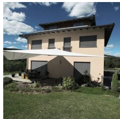
Raffstoren und moderne Sonnensegel, geplant und montiert von Jalousien-Lupk, Rut Lupk OHG

Referenzen zeigen am besten, was ein Betrieb leisten kann. Ob gewerbliche oder private Objekte in jeder Größe - wir realisieren optimale Lösungen für jede Anforderung. Perfekt, pünktlich und zu einem attraktiven Preis-Leistungsverhältnis.